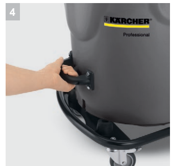
4 Удобная ручка