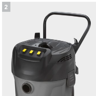
2 Эргономичная ручка