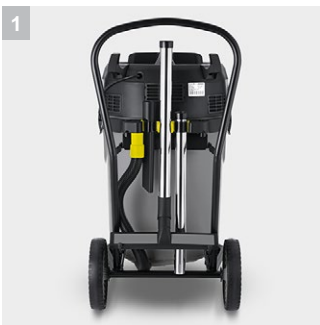
1 Интегрированный отсек для хранения аксессуаров

Впечатляющий своей мощностью трехтурбинный профессиональный пылесос влажной и сухой уборки NT 70/3 Me Tc из линейки профессиональных пылесосов влажной и сухой уборки Kärcher NT 70 которая состоит из больших и мощных пылесосов с различным количеством моторов, до 3 штук. Данная линейка моделей особенно незаменима и впечатляет своими возможностями когда речь идет о влажной уборке и возможности собирать крупный мусор. Высокая мощность всасывания и проверенное на деле качество от Kärcher по привлекательной цене.