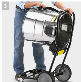
3 Откидное шасси